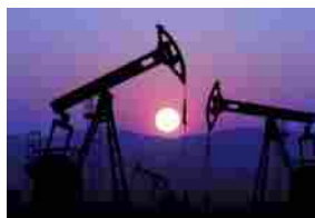
OIL & GAS - AVVIO DI