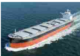
D'AMICO - IN ARRIVO AUMENTO