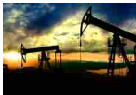
OIL & GAS - SETTIMANA CAUTA