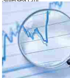
Piazza Affari il lieve calo: Ftse Mib -0,14%