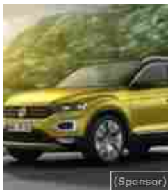
Le migliori auto 2018: ecco le sei finaliste