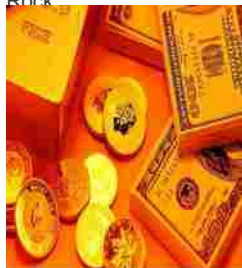
Energica Motor Company, perdita semestrale da € 2,98 mln