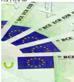
La borsa italiana accelera al ribasso nel finale: Ftse Mib