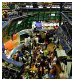
Wall Street sferzata dai venti di guerra, tecnologici al tan