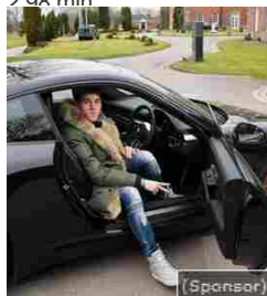
Ecco come un ragazzo di 18 anni si è arricchito con i Bitcoin