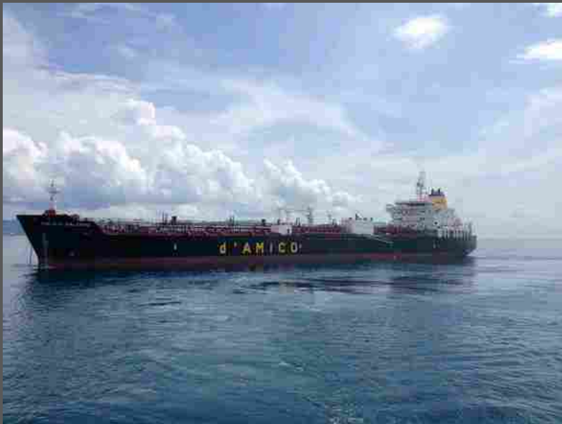
Un cargo d'Amico

(ANSA) - ROMA, 28 LUG - Via libera dal cda di d'Amico International Shipping (Dis) ai conti del primo semestre dell'anno chiusi con una perdita netta di 6,2 milioni di dollari, rispetto ad utili per 13,6 milioni dello stesso periodo del 2016 ed un ebitda pari a 24,7 milioni di dollari. I ricavi base del time charter sono stati di 128,7 milioni nel primo semestre 2017 rispetto a 144,5 milioni del primo semestre 2016 con un margine sul time charter del 19,2%. Ad incidere, si legge in un comunicato del gruppo soprattutto l'andamento del secondo trimestre chiusi con una perdita di 8 milioni di dollari. "Una prudente strategia commerciale ha permesso a Dis di mitigare gli effetti di un difficile mercato delle navi cisterna nel secondo trimestre dell'anno, parzialmente imputabile ad un effetto di stagionalità", afferma l'amministratore delegato Marco Fiori. "Questo principalmente a causa delle numerose consegne di nuove navi sul mercato, assieme all'intensa fase di manutenzione e ad un ancora elevato livello di scorte di prodotti petroliferi. Sono pertanto abbastanza soddisfatto dei risultati raggiunti dalla nostra Società nel corso del primo semestre 2017, in questo contesto". I flussi di cassa netti di DIS per il primo semestre 2017 sono stati positivi per 9 milioni di dollari rispetto al