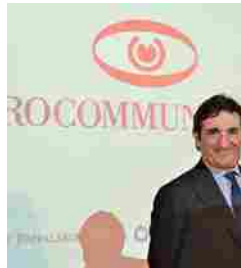
I Buy di oggi da Cairo Communication a Sogefi