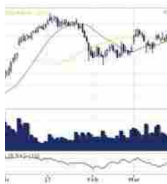
Eni chiude temporaneamente Centro Olio Val d'Anni