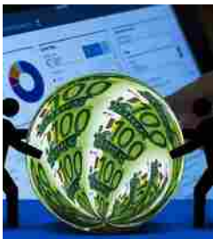
Risparmio gestito: quali i titoli buy dopo la raccolta di ma