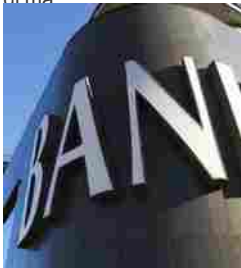
Bancari: un'occasione d'acquisto, ma non per tutti i titoli