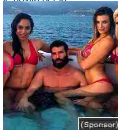
I Milionari Fenomeno del Momento? Il Trucco che c'è dietro!