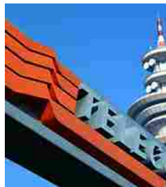
I Buy di oggi da Autogrill a Telecom Italia