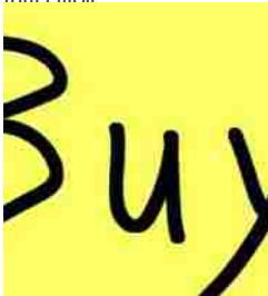
I Buy di oggi da A2a a Sogefi