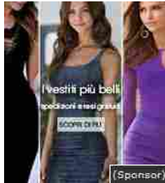
I vestiti per ogni occasione: scopri subito le novità per la